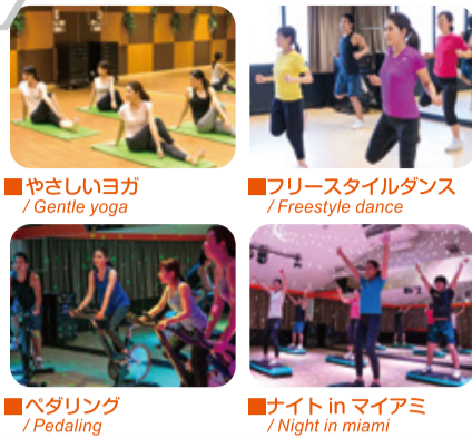
■やさしいヨガ / Gentle yoga ■フリースタイルダンス / Freestyle dance ■ペダリング / Pedaling ■ナイト in マイアミ / Night in miami

豊富なプログラムで飽きのこない アクティブフロア!! 最新の音響機器と 光の演出で、気分も上がる!!