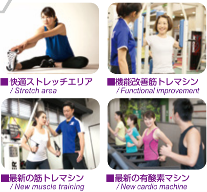
■快適ストレッチエリア / Stretch area ■機能改善筋トレマシン / Functional improvement ■最新の筋トレマシン / New muscle training ■最新の有酸素マシン / New cardio machine