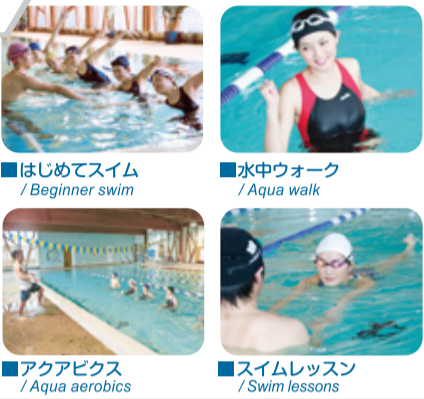
■はじめてスイム / Beginner swim ■水中ウォーク / Aqua walk ■アクアビクス / Aqua aerobics ■スイムレッスン / Swim lessons