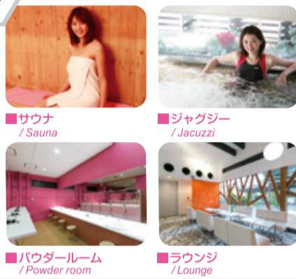
■サウナ / Sauna ■ジャグジー / Jacuzzi ■パウダールーム / Powder room ■ラウンジ / Lounge

運動後は、極上の寛ぎ空間で、 自分だけの時間を堪能!! 入浴だけの利用でもお値打ちです!!